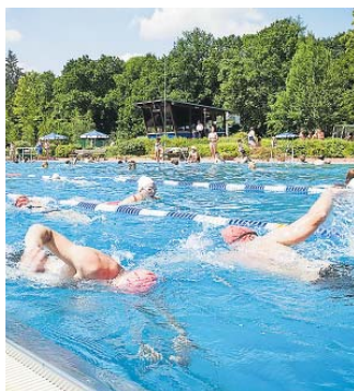
Das Parkbad Schwabach heißt seit 5. Mai die Badegäste herzlich willkommen.

V erlässliche 24 Grad, zumindest im Wasser – das ist ab sofort im Parkbad wieder Programm. Bis Mitte September können Badenixen und Wasserratten wieder in dem 50-Meter-Becken ihre Bahnen ziehen, eine Rutschpartie genießen, im Strömungskanal plantschen, Sonne tanken und den Sommer genießen. Die Öffnungszeiten sind unverändert: bis September jeden Tag von 7:30 bis 20 Uhr, mittwochs für die Frühschwimmer schon um 7 Uhr. Im September endet