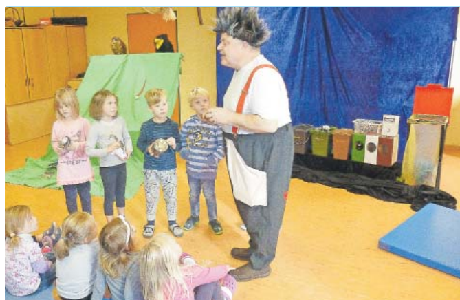
Gemeinsam wurde mit den Kindern besprochen, in welche Behälter die Abfälle rein müssen, damit die Wiese wieder sauber wird.