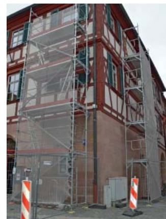
Rechts neben dem Rathauseingang ist ein Teil des Gebäudes mit Zäunen und Baken abgesperrt.

An der Südost- sowie an der Westseite der Rathausfassade ist Ende April ein Gerüst aufgestellt worden. Grund dafür sind weitergehende Untersuchungen an der Außenfassade. Dabei werden Schadbereiche, die im letzten Sommer entdeckt wurden, begutachtet. „Es werden nun Gefachfelder herausgenommen“, so Frank Daginnus vom Amt für Gebäudemanagement „um die Innenkonstruktion anzusehen.“