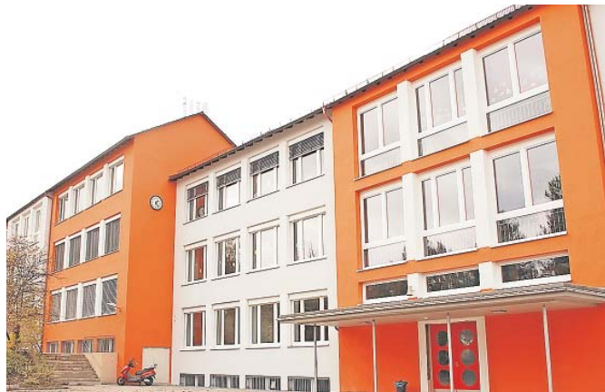
Auch in die Johannes-Helm-Schule soll langfristig investiert werden.

Zum anderen liegen die Steuereinnahmen derzeit auf Rekordniveau. Die Stadtverwaltung erhält im Wesentlichen Grund- und Gewerbesteuern und einen Anteil an der Einkommens- und Umsatzsteuer. Das führt dazu, dass die Stadt derzeit einen Überschuss aus der laufenden Verwaltungstätigkeit erwirtschaften kann. Das heißt vereinfacht gesagt, dass sie in einem Jahr mehr einnimmt, als sie ausgibt. Damit will die Stadt geplante und notwendige