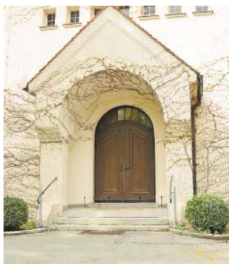
Hier wird eine Rampe angebaut.

ergänzt: „Bisher mussten wir gehbehinderte Menschen über einen anderen Ausgang und in den angrenzenden Betriebshof hinausgeleiten. Dadurch wurden sie kurzfristig von der Trauergemeinde getrennt.“ Weil die Kapelle während der Umbaumaßnahmen nicht genutzt werden kann, wird während dieser Zeit der Pavillon am Grabfeld