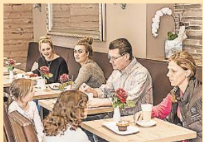
Das Motiv im Mai: Schlemmen im Backhaus Lederer-Café

Auch im Mai wartet beim Online-Gewinnspiel zum Familienkalender der Stadtwerke ein toller Gewinn: ein Gutschein für das Backhaus Lederer-Café in Höhe von 25 Euro. Die Rätselfrage lautet: Was wird im Bäckerhandwerk ein „Schießer“ genannt? Wer es nicht weiß, findet online Hilfe: www.stadtwerke-schwabach.de ; Rubrik Magazin und Kalender.