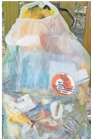
Gelbe Säcke mit Restmüll bekommen einen roten Punkt: Bitte nachsortieren.

Beim Gelben Sack handelt es sich nicht um ein städtisches Abfall-System, sondern um ein privates. Für die gesamte Erfassung und Verwertung der Leichtverpackungen ist der private Handel mit seinen beauftragten Entsorgern verantwortlich. In Schwabach sind dies die Firma Hofmann und ihr Subunternehmer, die Firma Bonn. Die Stadt hat, im Rahmen einer