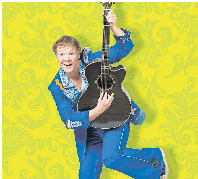
In die Schule, mit dem Bus – dieser Klassiker darf bei Geraldinos Auftritt natürlich nicht fehlen.

Beim Familienkonzert im KuBuS spielt er seine größten Live-Hits: darunter Spaß-Songs, Immerwieder-Mitsing-Lieder und natürlich Mitmach-Hits. Gemeinsam mit dem Publikum singt Geraldino natürlich auch die berühmte Hymne auf den Schulbus. Für Kinder ab vier (und natürlich auch deren El-