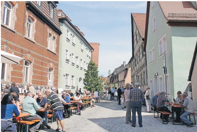
Tag der offenen Tür im frisch gemachten Haus mit der Nummer 15 (rechte Seite): Die Besucher konnten die zwei Wohnungen besichtigen.

Einweihung des frisch sanierten Hauses beim Tag der offenen Tür