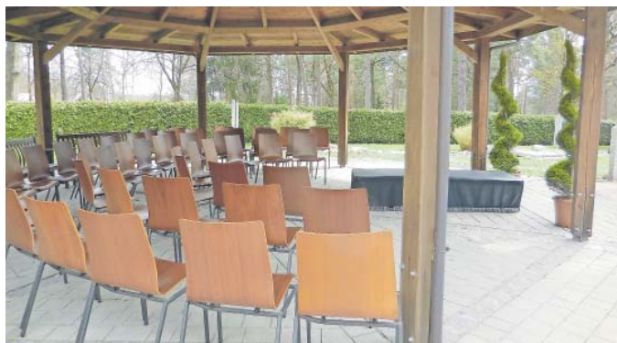
Eine „Kapelle im Grünen“ wird der Pavillon beim „Fluss der Zeit“.

Haupteingang ist für etwa zehn Wochen geschlossen