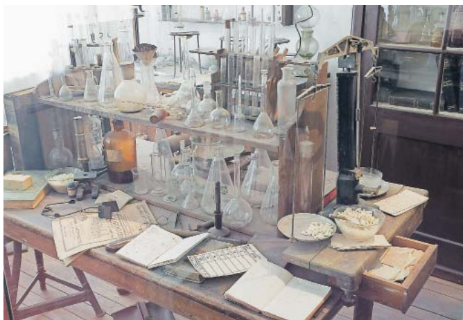
Blick in die historische Seifenabteilung

Das Stadtmuseum ist an diesem Tag bei freiem Eintritt von 10 bis 18 Uhr geöffnet und bietet währenddessen Führungen durch die Ribot-Abteilung stündlich